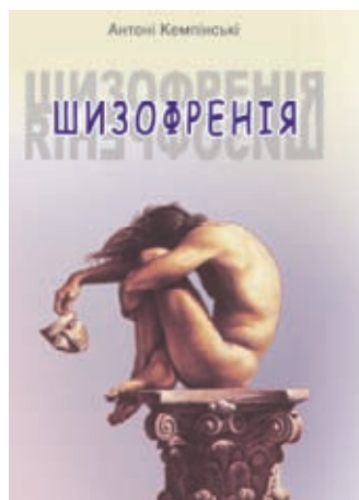
Україномовне видання книжки «Шизофренія»

У листопаді 1963 р. у Краківській Медичній академії вчений отримав звання доцента, а у березні 1972 р. Державна Рада присвоїла йому звання професора. А. Кемпінські також очолив кафедру та психіатричну клініку. Його лекції були дуже популярними серед студентів та молодих лікарів у