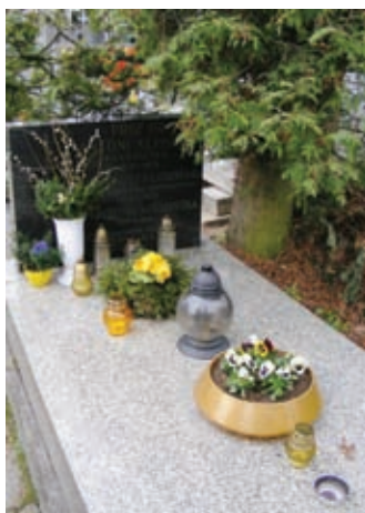
Могила і пам'ятник А. Кемпінські на Сальвадорському кладовищі м. Краків

Україномовне видання книжки «Пізнання хворого»